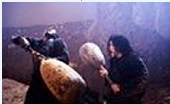
Da "Mahabharata" di Peter Brook