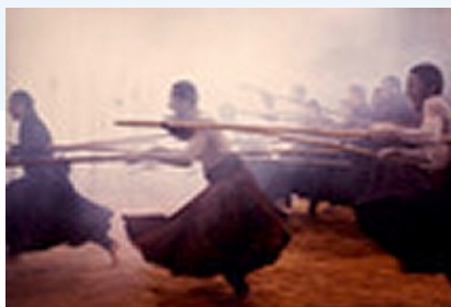
Da "Mahabharata" di Peter Brook