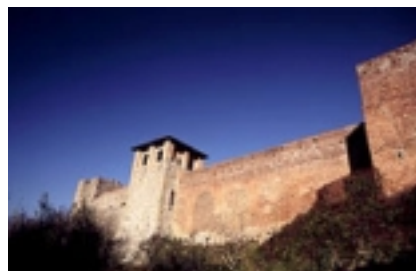
Montecarlo-Lucca : la fortezza

Dal 1981 si occupa di scrittura e regia, prima