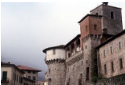
Castelnuovo Garfagnana : la rocca