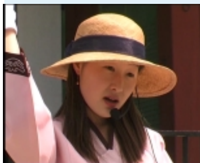
Una scena del documentario "Koreality" di Rolf Mandolesi sulla realtà della nazione del sud-est asiatico.

L'Autore ha presentato al Concorso anche il film "Change" sull'ascesa vertiginosa verso il socialismo di mercato della Cina.