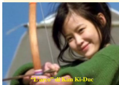
“L'arco” di Kim Ki-Duc