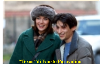
"Texas" di Fausto Paravidino

di Fausto Paravidino con Valerio Binasco, Valeria Golino, Fausto Paravidino, Riccardo Scamarcio