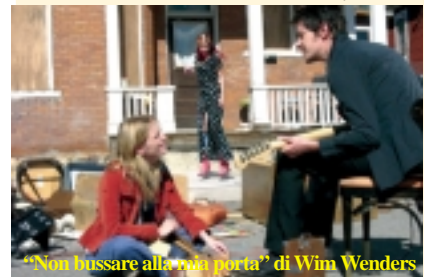
"Non bussare alla mia porta" di Wim Wenders

NON BUSSARE ALLA MIA PORTA di Wim Wenders con Sam Shepard, Jessica Lange, Tim Roth, Gabriel Mann, Sarah Polley