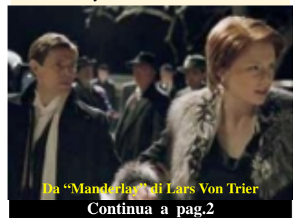
Da "Manderlay" di Lars Von Trier

MANDERLAY di Lars Von Trier con Bryce Dallas Howard, Isaach De Bankole', Danny Glover e Willem Dafoe