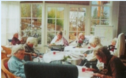
Una scena di "Sala d'attesa" di Rolf Mandolesi

IL VENTO NELLE MANI di Carlo Grenzi-11'; IMPRESSIONI DI UN PAESAGGIO di Roland Kirchlechner e Roland Kröss ; SALA D' ATTESA di Rolf Mandolesi - 12'.