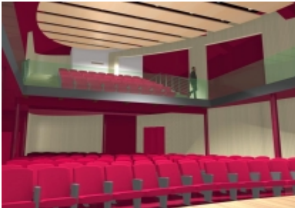
L'auditorium dove opera il Cineclub "Poggio Bracciolini"

Il Cineclub FEDIC "Poggio Bracciolini" prende vita da un progetto, risalente all'estate scorsa, che affonda le proprie radici nella spinta culturale che un gruppo di persone ha sentito di dover muovere nei confronti della propria comunità di riferimento. In specie rimane giusto ricordare che la spinta decisiva al progetto è stata portata dalla nascita, a Terranuova Bracciolini, di un Auditorium comunale (inaugurato lo scorso 30 settembre, ndr) atto ad accogliere manifestazioni culturali relative alle arti dello spettacolo. Almeno inizialmente l'indirizzo della Amministrazione Comunale era improntato alla promozione del teatro e della musica, prevedendo per altre opportunità culturali uno