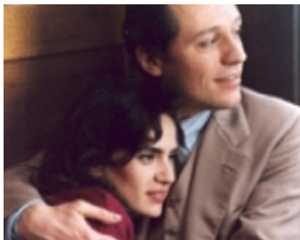
"L'amore ritrovato" di Carlo Mazzacurati

STA DEI PUGNALI VOLANTI di Zhang Yimou ; Venerdì 8 : IL MERCANTE DI VENEZIA di Michael Radford; Sabato 9 : LE CROCIATE di Ridley Scott ; Domenica 10: ROBOTS di Chris Wedge.