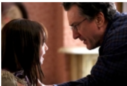
"Nascosto nel buio" di John Polson

Venerdì 24 : L'APPARENZA INGANNA di Francis Veber ; Sabato 25 : TU LA CONOSCI CLAUDIA ? di Massimo Venier;