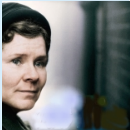
"Il segreto di Vera Drake"