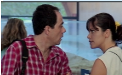
Corti di Valdarno Cinema Fedic 2004: Un fotogramma del film "Che fine hanno fatto gli etruschi?" di Emanuela Pesando

In particolare, i "corti" di San Giovanni Valdarno e di Montecatini sono stati videoproiettati ad Albenga, Ceriale, Peagna, Toirano, Villanova, all'aperto oppure in sala. Il numeroso pubblico ed il grande entusiasmo sono stati molto incoraggianti, tanto che i Comuni interessati hanno promesso di ripetere la positiva esperienza nella prossima stagione estiva nell'ambito delle attività culturali.