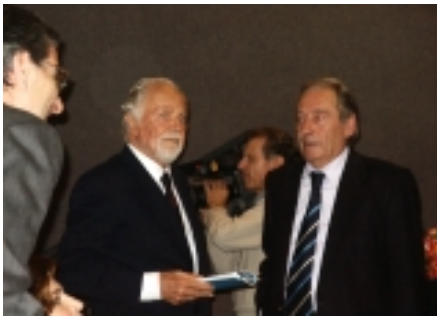
L'attore Gabriele Ferzetti con il Presidente del Festival al Cinema Marilyn