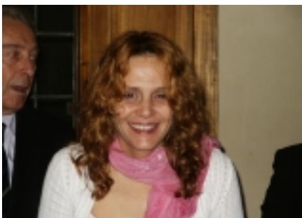
L'attrice Antonella Ponziani in Palazzo d'Arnolfo