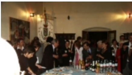
Sopra e sotto : due momenti del "brindisi di arrivederci" in Palazzo d'Arnolfo