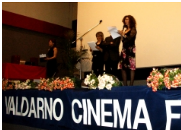
L'attrice Anna Galiena legge il verbale della Giuria