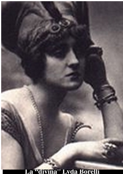
La "divina" Lyda Borelli