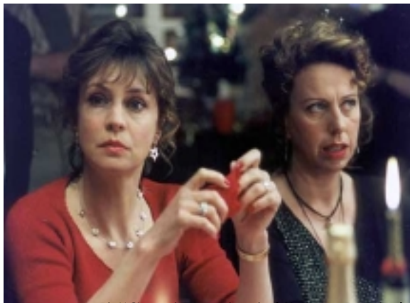
Una scena di "Caterina va in città" di Paolo Virzì

18 Marzo - "DILLO CON PAROLE MIE" di Daniele Luchetti con S. Montorsi, M.