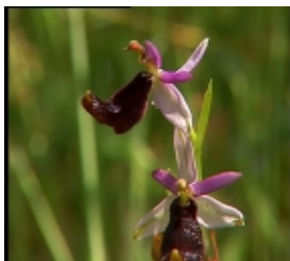
Da "Breeze" (Vento nel Parco)

Premio per la fotografia a DIE FOR ME di Anna de Manincor , per aver saputo rendere bella e suggestiva anche una raffineria, con uso sapiente delle luci e dei suoi riverberi sulle acque di scarico, narrando una "notte brava" di alcuni amici in cui traspare il disagio giovanile in un ambiente fortemente antropizzato dalla presenza di infrastrutture energetiche.