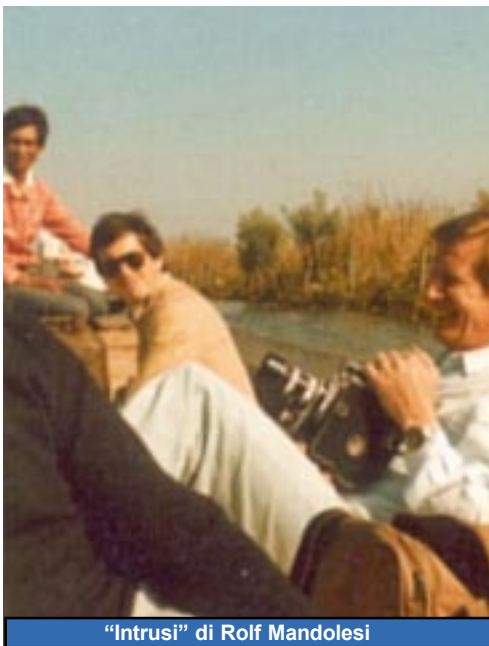
"Intrusi" di Rolf Mandolesi

Mercoledì 30 Luglio - Sala Civica: Retrospectiva delle opere dei soci del Super8 & Video Club Merano