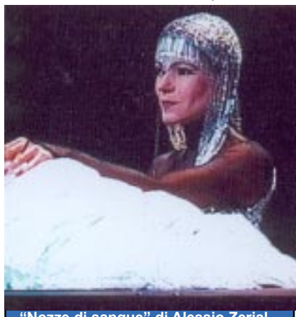
"Nozze di sangue" di Alessio Zerial

KM 42,192 del Super8 & Video Club Merano fedic (1988); UOMINI di Rolf Mandolesi (1988); AIUTIAL TERZO MONDO di Rolf Mandolesi (1989); COLOUR di Günter Haller (1991); EIN AHNENHOF di Sepp Unterweger (1991); HADIMBAS REISE di Lisl Heumader (1991); APPLES di Rolf Mandolesi (1991); PROMENADE, ZIELSCHEIBE FÜR FOTOGRAFEN di Roland Kröss; MERANER