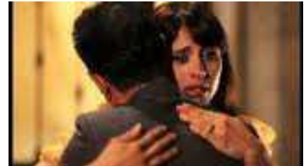
"SOTTO CASA" di Alessio Lauria (Italia)

modo in cui l'autore ha saputo emozionare il pubblico, rendendo visibile-attraverso un'approfondita lettura psicologica dei personaggi – un insostenibile spaccato di emarginazione giovanile.