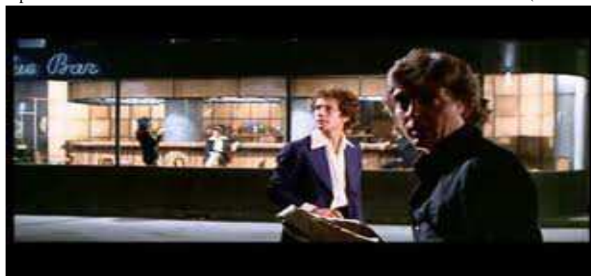
Una scena del film "Profondo rosso" di Dario Argento

Concludono la rassegna altri tre film: "Profondo rosso" di Dario Argento (film da moltissimi anni assente dalle sale cinematografiche, in programma lunedì 20 agosto, in omaggio al 70° compleanno di Gabriele Lavia, che ricorre proprio quest'anno), "La febbre del sabato sera" di John Badhan con John Travolta (lunedì 27