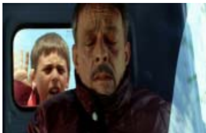
Un fotogramma del film