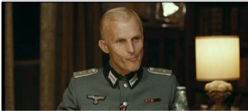
Nelle foto : due immagini del film “Appartamento ad Atene”

editrice, lei una donna di casa, ansiosa e malaticcia. I due hanno un figlio di dodici anni animato da melodrammatiche fantasie di vendetta, e una bambina di dieci che soffre di un forte ritardo mentale. Con l'arrivo del capitano Kalter tutto è cancellato.