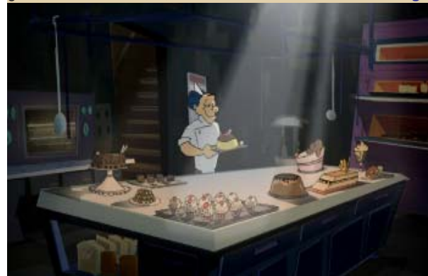
Un fotogramma de "Il pasticcere"

Si può ancora parlare di cinema, quando non c'è una storia da raccontare a chi chiede di "cosa parla" un film già visto?