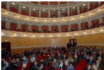
Teatro "La fortuna, sede del Festival"