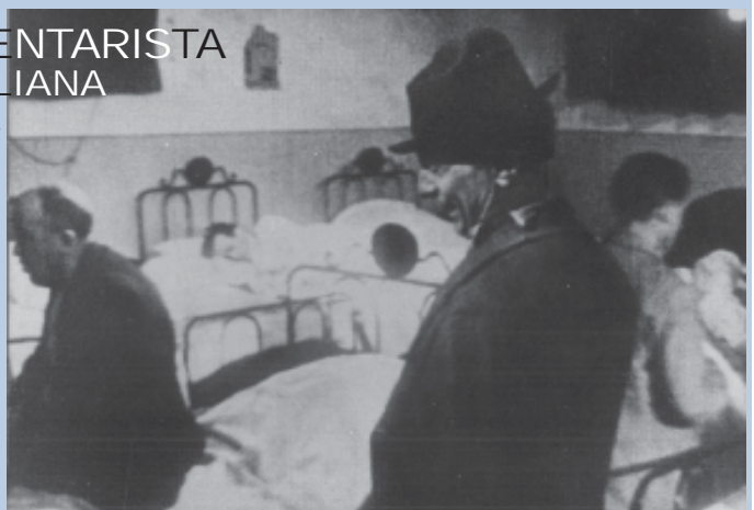
Un fotogramma del documentario "Uomini soli"