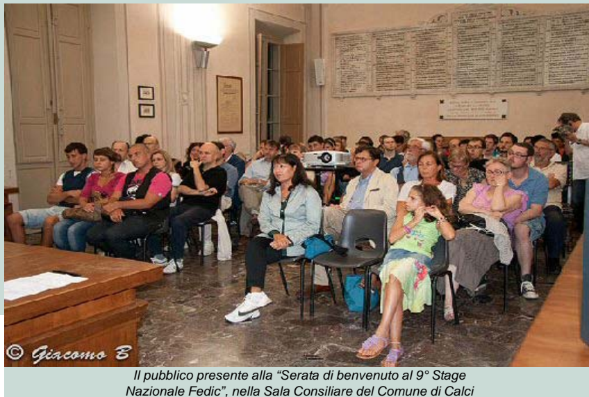
Il pubblico presente alla "Serata di benvenuto al 9° Stage Nazionale Fedic", nella Sala Consiliare del Comune di Calci

Gli stagisti hanno trascorso le loro intense giornate all'interno dell'amenissimo agriturismo "I Felloni", trovando nella "limonaia" il posto ideale in cui lavorare, spostandosi -a seconda delle occasioni- in un giardino, nel solarium, ecc. Tanti accoglienti angoli della dimora collinare, insomma, diventavano a turno sede di discussioni, lezioni e svago. L'aula appositamente allestita al secondo piano del corpo centrale dell'agriturismo... non è mai stata usata!