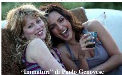
“Immaturo” di Paolo Genovese

Venerdì 12 Agosto : Piazza del Comune- film “Immaturo” di Paolo Genovese