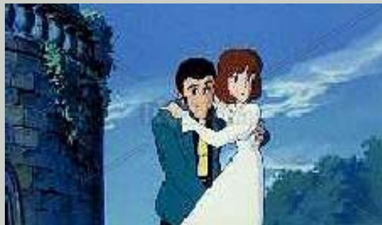
Un fotogramma di "Lupin III, il castello di Cagliostro"

A Spazio Cinema proseguono gli appuntamenti dedicati ai grandi film di animazione di Hayao Miyazaki. Dopo "Totoro", "Ponyo" e "Il castello errante di Howl", domenica 22 maggio è arrivato nella sede del Cineclub (in via Bellini 7), il film che ha fatto conquistare al regista giapponese l'"Orso d'oro" a Berlino e, poco dopo, l'Oscar come migliore film d'animazione.