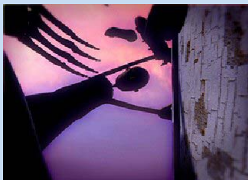
"Armi su strada" di Bruno Bozzetto

Il Cinevideo Club Bergamo da quest'anno ha pure modificato il proprio logo, un buon auspicio in previsione del 60° di fondazione 2012.