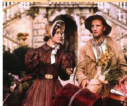
"Domani accadrà" di Daniele Luchetti