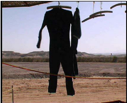
Un fotogramma tratto da "Il grido di Cassandra" di Rolf Mandolesi

Al pluripremiato autore i complimenti della redazione.