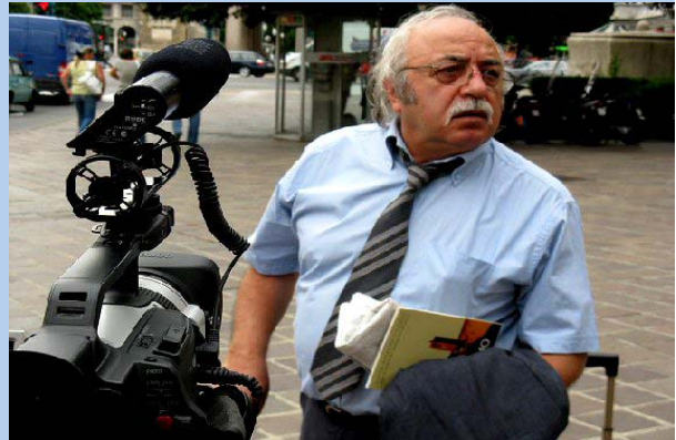
Sossi alle Grazie-Giugno 2009

Il primo illustra quali e quanti risultati positivi si raggiungono grazie a un volontariato che si impegna e si organizza per combattere l'indegno sfruttamento di tante ragazze, alcune minorenni. "Donne comprate e vendute" , commenta l'autore, sottolineando che "sulla strada non si coltiva solo paura. Diamo un nome alle storie per averne cura..." .