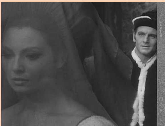
"Mandragola" di Alberto Lattuada.