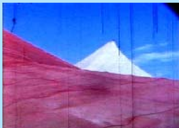
"Settima galassia" del 1965