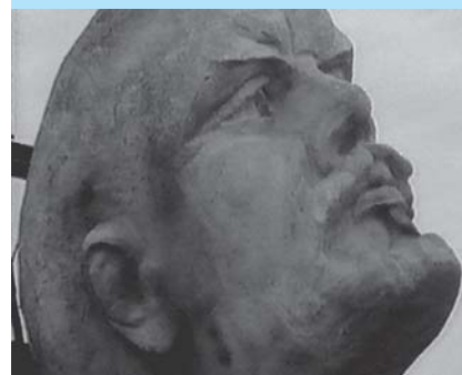
"Deposizione" del 2002