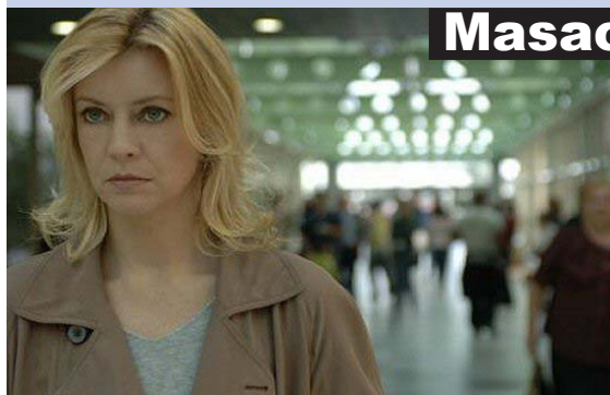
Margherita Buy nel film "Matrimoni e altri disastri"

Prosegue, al Cinema-Teatro Masaccio, il ciclo di film "Masaccio d'essai", organizzato dal Cineclub sangiovese in collaborazione con il Comune della città e l'Associazione "I Visionari".