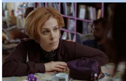
"L'uomo dei sogni"

L'UOMO DEI SOGNI di Alessandro Capitani e Alberto Mascia - 24'