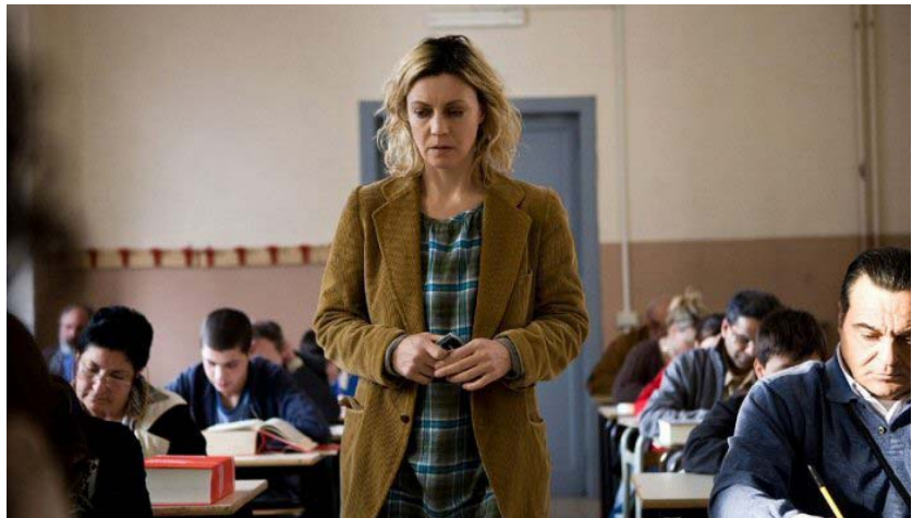
Margherita Buy ne "Lo spazio bianco"