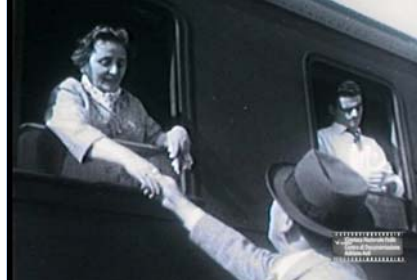
"Cena per due"

IL GOTICO SENESE di G.Parenti (1960, 14')