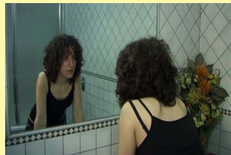
"Intrusion" di Guido Daidone

-LE STELLE DI ANTONELLA di Gabriella Vecchi -DIVERSITA' di Vito D'Ambrosio -LA MIA SICILIA di Giuseppe Leto -DIFFERENZE di Giuseppe Leto -IL DESTINO TRA LE MANI di Giuseppe Leto -L'EGIZIO di Piero Baloire -INSUPERABILI di Tiziana Spennacchio -FINALMENTE di Tino Dell'Erba