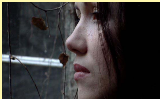
"La notte dei due innamorati" di Francesco Giusani

-IL MIO ULTIMO GIORNO DI GUERRA di Marco Tondini