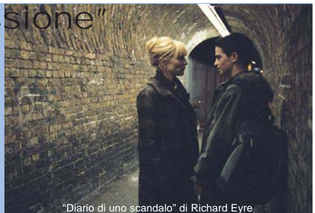
"Diario di uno scandalo" di Richard Eyre