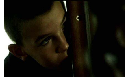
"Sa promessa" di Ilaria Godani (Cineclub Roma) e Giuliano Oppes (Cineclub.Sassari)

Presentiamo una prima tranche di film prodotti da autori Fedic pervenuti alla segreteria del Festival per il Concorso Nazionale "Premio Marzocco 2010"