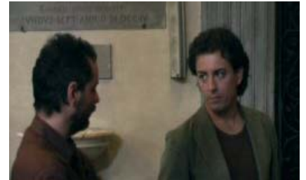
"Il miracolo del latte" di Antonio Fabbrini del Cineclub Sangiovese.