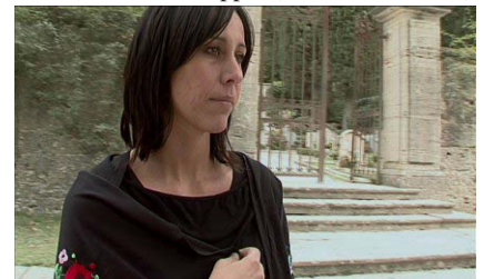
"Lei" di Paolo Cappelli del Cineclub di Chianciano Terme