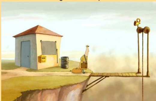
POST di Christian Asmussen

MALBAN di Elodie Bouédec, Francia, Premio della Giuria, che ha inteso attribuire il giusto valore valorizzare alla raffinata grafica e alla preziosa estetica del