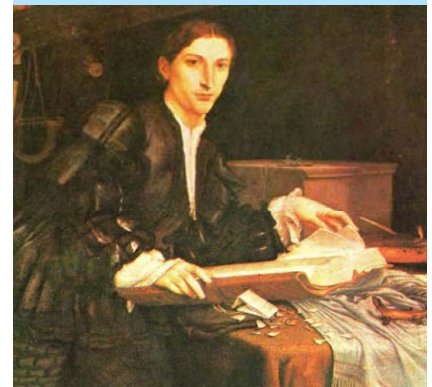
Lorenzo Lotto ritratto da giovane

Giovedì 14 gennaio ore 21: "Hopper, periferia d'anima" di Ettore Ferretti(*) del Cine Club Roma "Hopper in the road" di Ettore Ferretti(*) del Cine Club Roma. "La Leggenda di Barbara e altri racconti" di Gigi Corsetti (**) del CVC BG