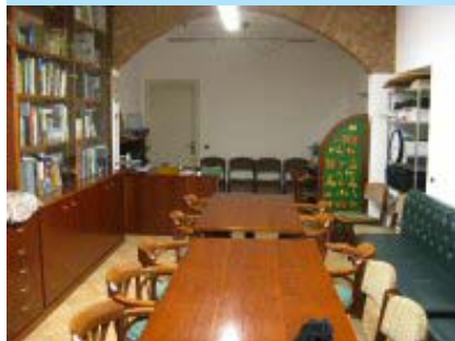
Una sala del Circolo Greppi

Sempre da gennaio, ma al pomeriggio, si effettuerà il nuovo "Corso sull'uso della videocamera" che comprende: Linguaggio filmico - Ripresa - Montaggio e Colonna sonora. Questa iniziativa si svolgerà nella sede del Sindacato Autonomo Bancari di Bergamo.