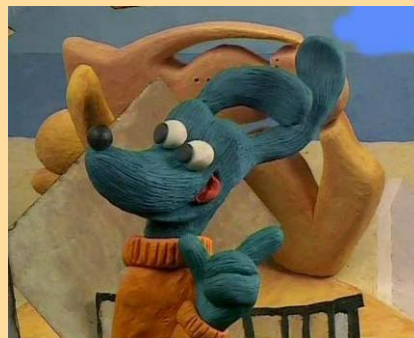
Da "Peo Picasso" di Fusako Yusaki

È il segno il protagonista dei ventottomila disegni realizzati per il capolavoro di Back in cui diverse tecniche, quali il carboncino e i pastelli si fondono con il solo fine di adoperare l'animazione e l'arte al servizio dell'ambiente.