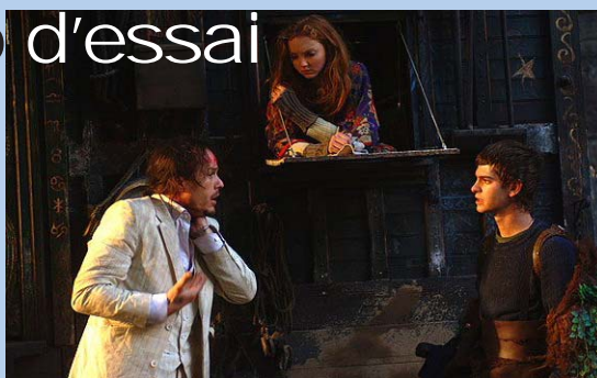
Sopra: "Parnassus-l'uomo che voleva ingannare il diavolo" Sotto: "A serious man" di Joel e Ethan Coen