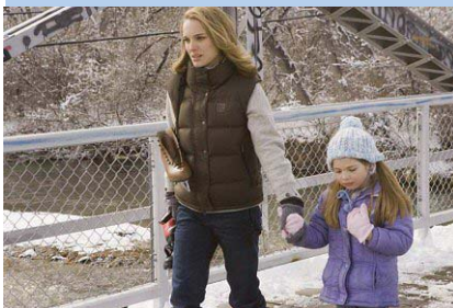
Un fotogramma di "Brothers"

Venerdì 25 dicembre ore 16.00 e 21.30 Sabato 26 dicembre ore 15.00, 17.00 e 21.30 Domenica 27 dicembre ore 15.00, 17.00, 21.30 "BROTHERS" di Jim Sheridan con Jake Gyllenhaal, Natalie Portman, Tobey Maguire