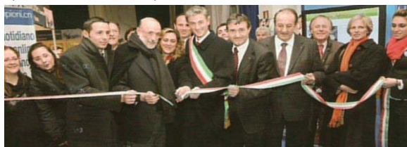
L'inaugurazione della Fiera Fredda

Durante l'incontro è stato presentato il documentario "Il 1° laboratorio del gusto" dedicato alla chiocciola Helix Pomatia Alpina realizzato da Lorenzo Fantoni, del Cineclub Fedic Piemonte-Torino, durante la scorsa edizione. Erano presenti il Sindaco ed il presidente della "Banca di Caraglio, del Cuneese e della Riviera dei Fiori" che ha sponsorizzato la stampa dei libri.