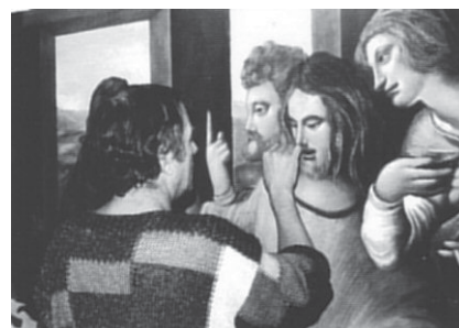
Da "Un nomade da marciapiede" di Beppe Rizzo

Sabato 14 Novembre 2009, alle 20,30, presso il Centro della Cultura di Merano si svolgerà una Serata d'Autore con Beppe Rizzo del Cineclub Alassio. Questo il programma: "Un nomade da marciapiede" - 27'; "Anhelitus" - 1'; "Appuntamento con Hitchcock" - 4'; "Ligustro" - 9'; "Incontro" - 3'; "Warum (perchè)" - 5'; "Gibba nella città di cartone" - 15'; "A livella" - 9'; "L'uomo del mare" - 14'.