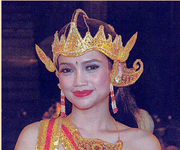
Un fotogramma del reportage Indonesia 2009

coinvolgere tanta gente, aziende e associazioni e non ultimo il Comune di Vigevano hanno permesso di portare in Kenia migliaia di euro in tre anni e realizzare una cosa meravigliosa, insieme a tanti altri compagni. “Questa scuola è di tutti gli amici sparsi in tutta Italia che ci hanno aiutato consentendo di realizzare questo progetto per educare e crescere al meglio questi bambini”.