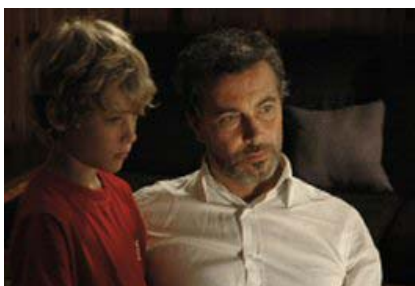
Un fotogramma de “La preda”

“LA PREDA” DI FRANCESCO APICE VINCE IL PREMIO DEL PUBBLICO ALL’ I’VE SEEN FILM INTERNATIONAL FILM FESTIVAL.