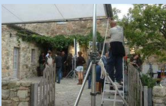
Sul set de “La bellezza del somaro”.Sullo sfondo Sergio Castellitto