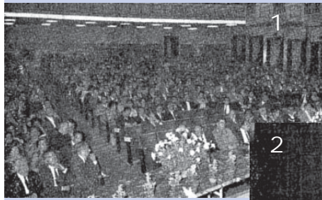
Foto 1 - Una visione della sala del Cinema Kursaal di Montecatini Terme la sera della premiazione dei vincitori del XIV Concorso Nazionale dei cineamatori.

Per l'accesso in sala degli uomini erano obbligatori giacca e cravatta.