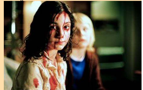
"Lasciami entrare" di Tomas Alfredson