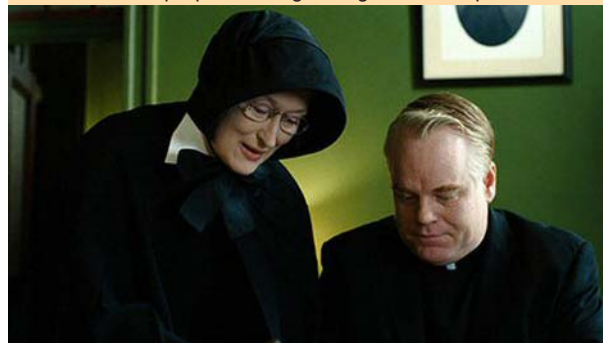
"Il dubbio" di John Patrick Shanley

THE WRESTLER di Darren Aronofsky con Mickey Rourke, Marisa Tomei, Evcan Rachel Wood. (Stati Uniti)