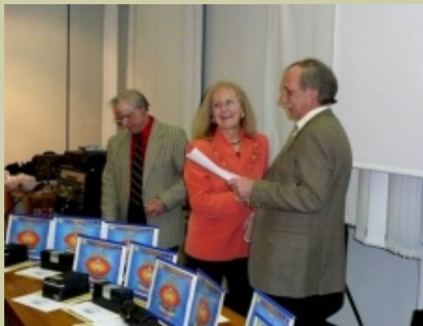
Un momento della premiazione