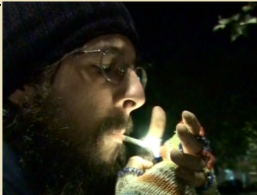
"Viaggio di un poeta" di Paolo Maggi