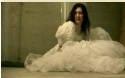
"La sposa vergine" di Massimo Alborghetti