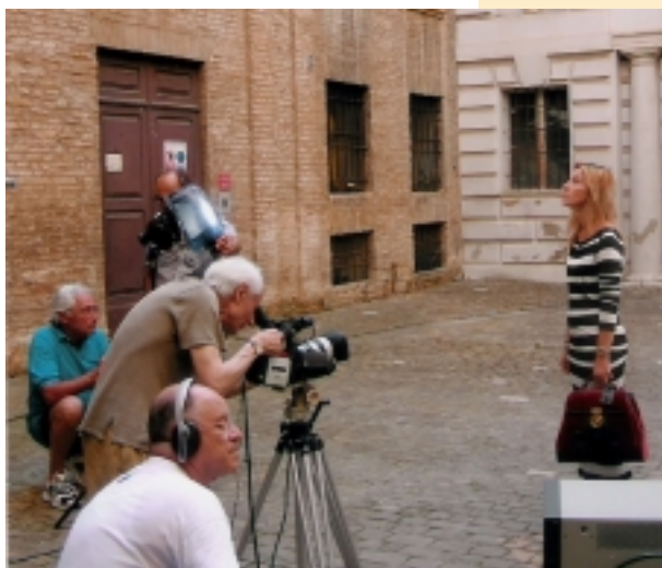
Si gira "Titolo provvisorio" di Agostino Vincenzi

LA CITTA' DEL DRAGO di Giorgio Savio PROVE DI PULIZIA di Vivian Tullio TRA GLI ALBERI LUNGO IL FIUME di Sereno Tullio TRASPARENZE di Giorgio Sabbatini FINE DEL TEMPO di Mauro Ressa GEOS di Giuseppe Leto e Stefano Greco TROPPO TARDI di Giuseppe Leto CASTELLO DI PRALORMO di Giuseppe Leto