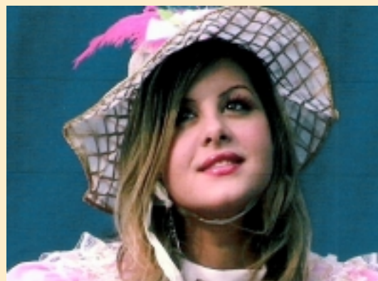
"Rodolfo e Galatea" di Tino Dell'Erba

MILANO CANTA di NedoZanotti IL VERO VOLTO DI AMIN di Mino Crocè e Albert Zanetovich