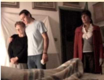
"Troppo tardi" di Giuseppe Leto

Cineclub Pesaro UNITI NELL'ABBRACCIO DI UNA STELLA di Giorgio Ricci ASPETTANDO LA COLLEZIONE DI ELIO GIULIANI di Giorgio Ricci DIETRO LE QUINTE DI "TITOLO PROVVISORIO" di Francesco Balbi TITOLO PROVVISORIO di Agostino Vincenzi