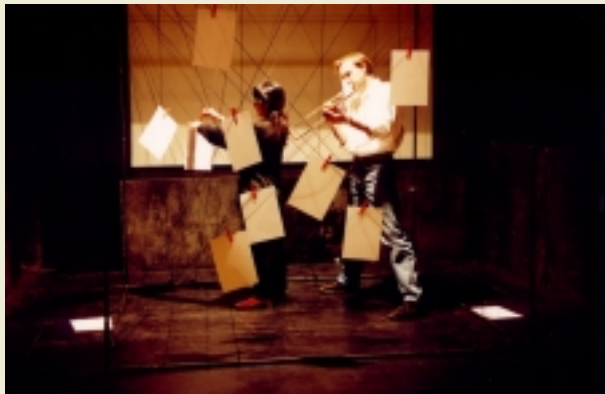
Zanasi- Cao "La Visione del Suono"

L'Associazione Intermediale ARKA (H.C.E.), in collabora- zione con l'Assessorato alla Cultura del Comune di Assemini (CA), hanno present- ato dal 15 al 28 febbraio - presso l'antica palazzina dell'Ex-Municipio