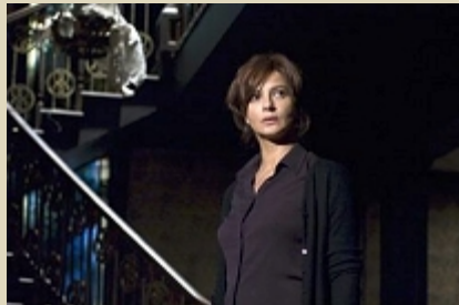
Un fotogramma de "Il nascondiglio" di Pupi Avati

7 Febbraio "GIORNI E NUVOLE" di Silvio Soldini con Margherita Buy, Antonio Albanese It.2007- Dramm.-116'