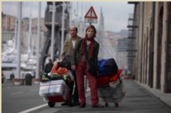
Una scena di "Giorni e nuvole" di Silvio Soldini

con Gabe Nevins, Taylor Momsen Fr/USA 2007 - Dramm. - 85'