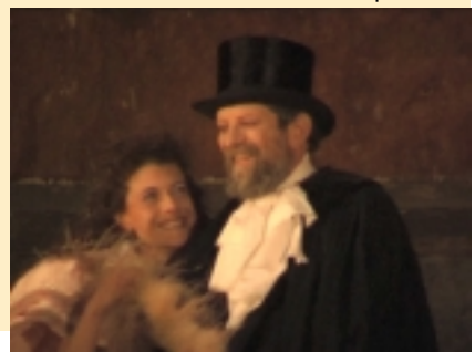
"Ombre di luna piena"

SCOGLI di Giovanni Leoni di Tarquinia VT