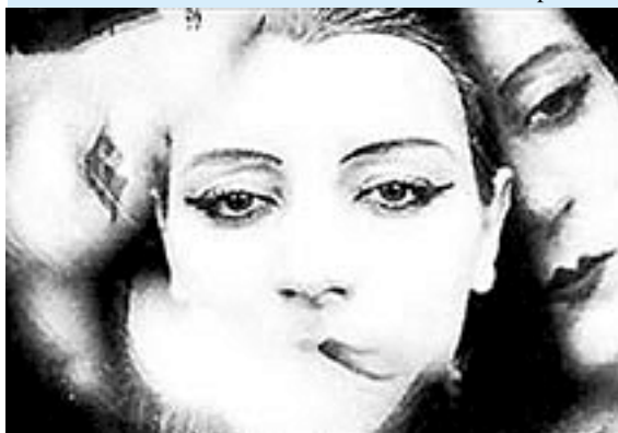
Una scena di "Le Ballette meccanique" di Fernand Léger

Il cinema trova nuove possibilità espressive da questa digitalizzazione. Da una parte ci viene offerto un sempre più spinto effetto realtà per stupirci e divertire; dall'altra parte telecamere digitali "in mano nostre" sono utilizzate per investigare la realtà, offrendo un altro tipo di realismo, per ampliare la nostra conoscenza/coscienza.