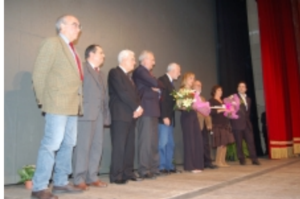
Un momento della serata conclusiva

1° premio Documentario di Euro 1000,00 + targa offerta dal Cineclub a IL CERCHIO