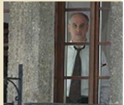
"La ragazza del lago" di Andrea Molaioli