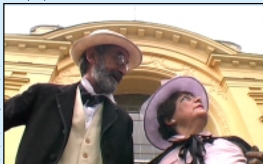
Una scena del film "Ritorno" di Rolf Mandolesi

- TARGA DEL DIRETTIVO: "AL CENTRO DELL'AMORE" di Minarini Francesco, Castel Bolognese - ALFONSINO D'ARGENTO BATTUTO DALLA ZECCA DI IGLESIAS NEL PERIODO MEDIEVALE, offerto dal COMUNE DI IGLESIAS: "ELEGIA" di Becker Holger, Amburgo