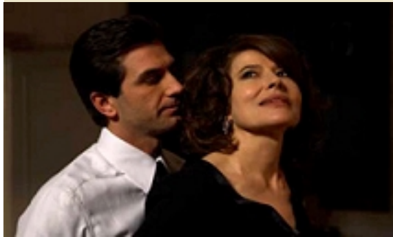
Una scena de "L'ora di punta" di Vincenzo Marra

L'assessorato al Turismo del Comune di Alassio e la Direzione del cinema Ritz, con la Direzione Artistica di Beppe Rizzo del Cineclub Fedic Alassio, presentano il programma "Novembre-Dicembre 2007" del