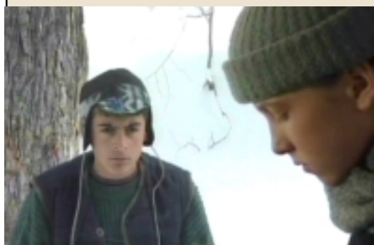
Nella foto: una scena del film “Eye level” di George Ovashvili in programma a Pistoia