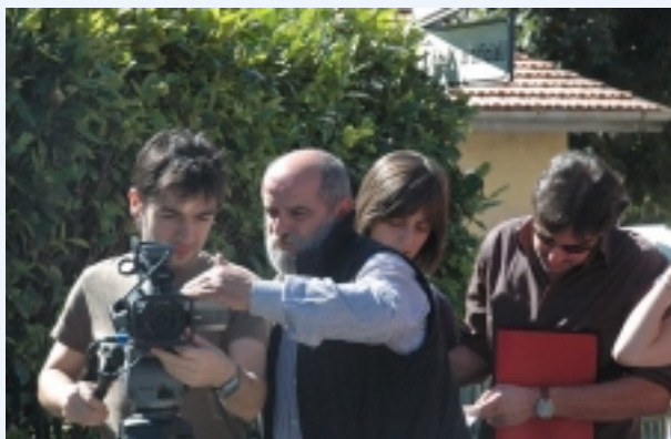
Un momento dello stage

Quest'anno lo stage prevedeva un laboratorio per registi cine-televisivi, o aspiranti tali, al termine del quale i partecipanti sono arrivati