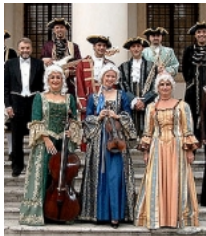
Il "Casanova Venice Ensemble" che partecipa alle celebrazioni

SOLO(1963) di Tullio Walluschnig ; FANTINI...IN SELLA (1964) di Virgilio Passaro; NOI POVERI MORTALI (1965) di Luciano Zanettini; A.G.007 (1967) di Walter Vettorelli; MENSCH, WAS MACHST DU ? (1974) di Sepp Unterweger; GIACOMINO (1983) di Alberto Lugli; LA FEBBRE DELL'ACQUA (1984) di Alpidio Balbo.