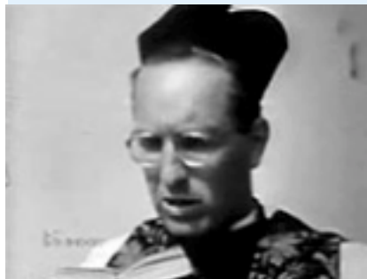
Da "Scano Boa" (1954)

La giuria popolare è stata molto incerta perché tre opere erano molto pregevoli ed alla fine ha prevalso il cortometraggio Fuori onda del Cineclub Corte Tripoli.