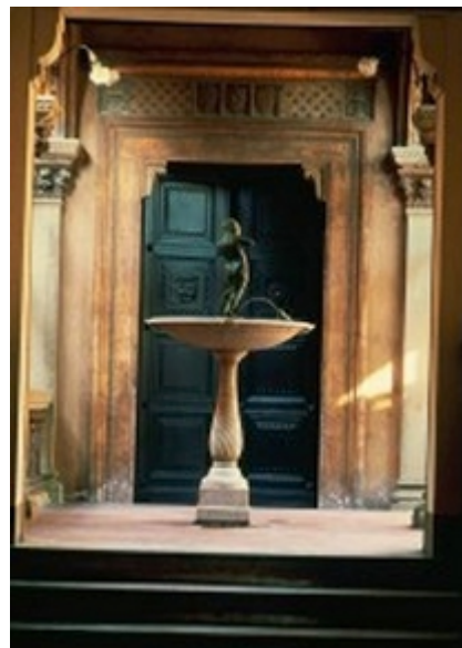
Le Terme Tamerici, sede del FilmVideo 2007

Esordisce come attrice in teatro nel 1997 con Puk, tratto da Sogno di una notte di mezza estate , in seguito lavora prima in cinema, dove esordisce con il film I cavalieri che fecero l'impresa (2001) di Pupi Avati e