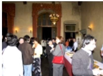
Valdarno Cinema Fedic 2007.

Un momento del "Brindisi di arrivederci" in Palazzo d'Arnolfo