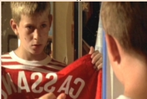
Un'immagine del film "Come a Cassano", Premio Marzocco 2007

Ha stabilito, pertanto, di assegnare i premi nel seguente modo: