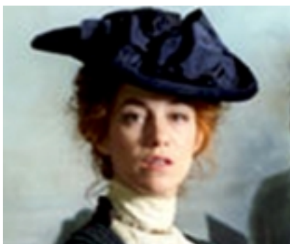
Charlotte Gainsborg nel film “Nuovo Mondo”

Il “cartellone” del festival 2007 comprende la presentazione del film “Nuovo Mondo” di Emanuele Crialese- Premio Fedic alla Mostra Internazionale d'Arte Cinematografica di Venezia 2006, (martedì 24 Aprile) della prima cinematografica de “I dilettanti” di Emanuele Barresi con la presenza del regista e di parte del cast (mercoledì 25 Aprile) e del film d'esordio di Giuseppe Piccioni “Il grande Blek” con la partecipazione del regista (venerdì 27 Aprile).