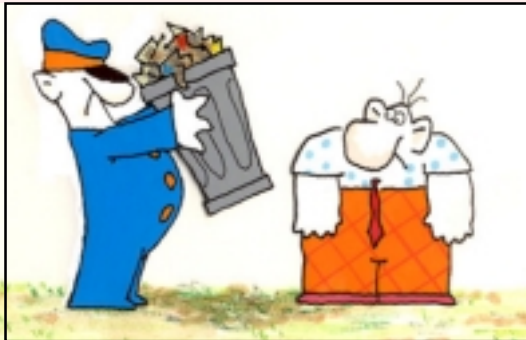
Da "Big bang" di Bruno Bozzetto

Il Forum ha dunque richiamato l'attenzione degli autori sul comportamento dell'uomo nei confronti dell'ambiente e sulle conseguenze che ne derivano. Il cortometraggio piace e interessa quando vi si riconosce un'attenzione reale e sentita al tema, unita alla capacità di sintesi per una comunicazione semplice ed efficace, in grado di raggiungere lo spettatore di ogni