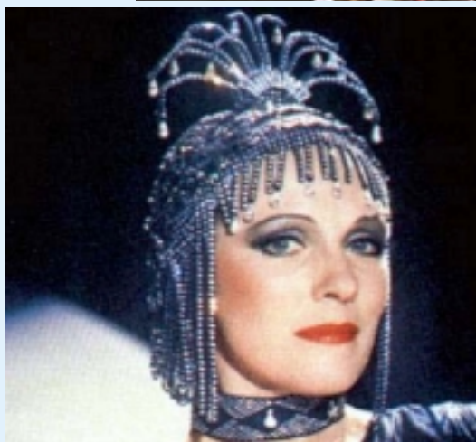
Sopra: "I segreti di Brokeback Mountain".Sotto: "Victor Victoria"

Brokeback Mountain" di Ang Lee (L'ambiguità e la doppezza), "Victor Victoria" di Blake Edwards, "Nikita" di Luc Besson (La spersonalizzazione), "Train de vie" di Radu Mihaileanu, "Il conformista" di Bernardo Bertolucci (Il trasformismo), "Zelig" di Woody Allen (Una, cento, mille identità). Tra i corti d'animazione ha brillato per l'attualità "Sottaceti", realizzato da Bruno Bozzetto nel 1976.