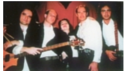
Un fotogramma de "La bella ed il Beatle"

Giovedì 23 Novembre 2006 si svolgerà, presso il "Centro della Cultura" di Merano, una "Serata d'Autore" dedicata al filmmaker FILIPPO LUBIATO.