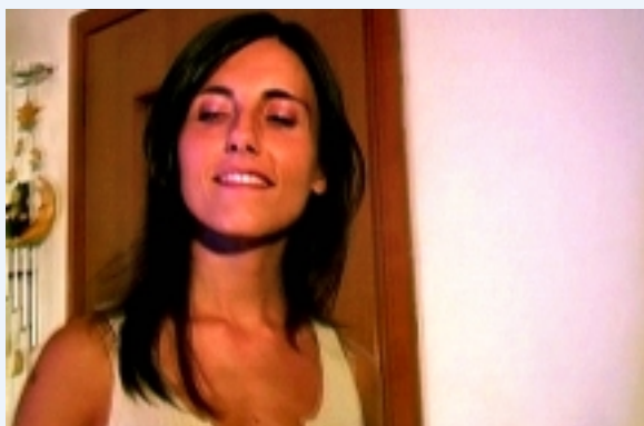
Un fotogramma di “Gelasia” di Livio Foini

Incontro/scontro tra le due personalità di un individuo, la coscienza che suggerisce per “il bene” e il “provocatore” che invoglia alla trasgressione.