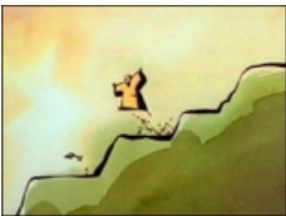
"Il monaco e il pesce" di Michael Dudok

Per l'animazione nel web usa Flash , un programma in grado di creare filmati con testi, immagini statiche e in movimento. Il cuore del programma è un organizzatore di sequenze animate. Dopo essersi soffermato sui vari strumenti da usare per costruire immagini, sfondi e personaggi con i relativi esempi, a conclusione della giornata Zanotti ha presentato due favole da lui reinterpretate: "La rana e la mucca" e "Il pesciolino d'oro".