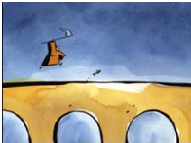
"Il monaco e il pesce" di Michael Dudok

Proiezione di animazioni con découpage , disegni e computer