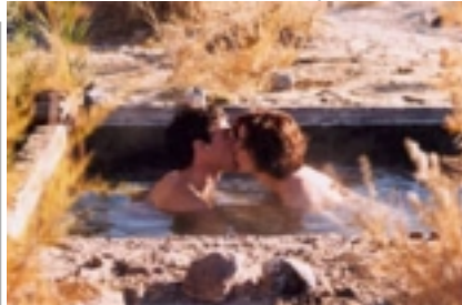
Una scena del film "Did You ever" di J.Leonard Stauber

La giuria esprime inoltre vivo apprezzamento per l'elevata qualità delle opere inviate dalla Scuola di Cinema di Animazione ENSAD di Parigi.