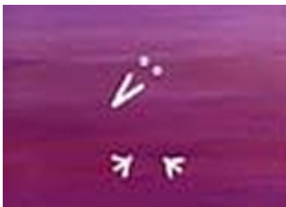
Da "Le merle" di Norman Mc Laren

McLaren, Lotte Reiniger, "Nosferatu Tango", 12'