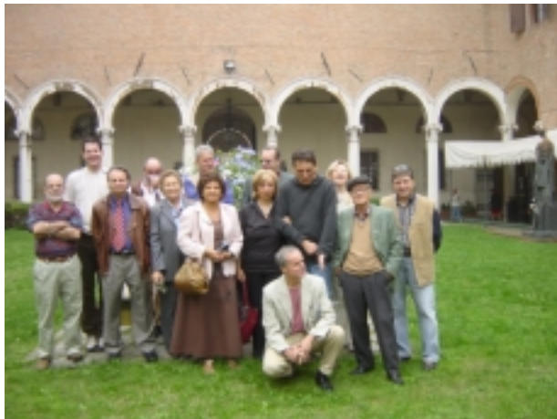
Il gruppo dei partecipanti

Si tratta di un nuovo evento che si affianca alla bella rassegna "Lo sguardo liberato" proposta dal Festival di Montecatini. Mentre l'evento di Montecatini si propone di osservare monograficamente gli autori Fedic, "Lo sguardo