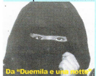
Da " Duemila e una notte "

della durata massima di 40"-significative foto di scena- anche in formato elettronico TIFF/300dpi-locandine, manifesti, etc., non restituibili), dovranno essere inviate entro il giorno 25 Febbraio 2002 a