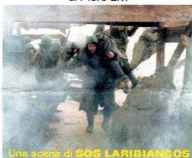
Una scena di SOS LARIBIANCOS

Giovedì 13 Dicembre 2001 ore 16,30-18,30 SOS LARIBIANCOS (I dimenticati) di Piero Livì