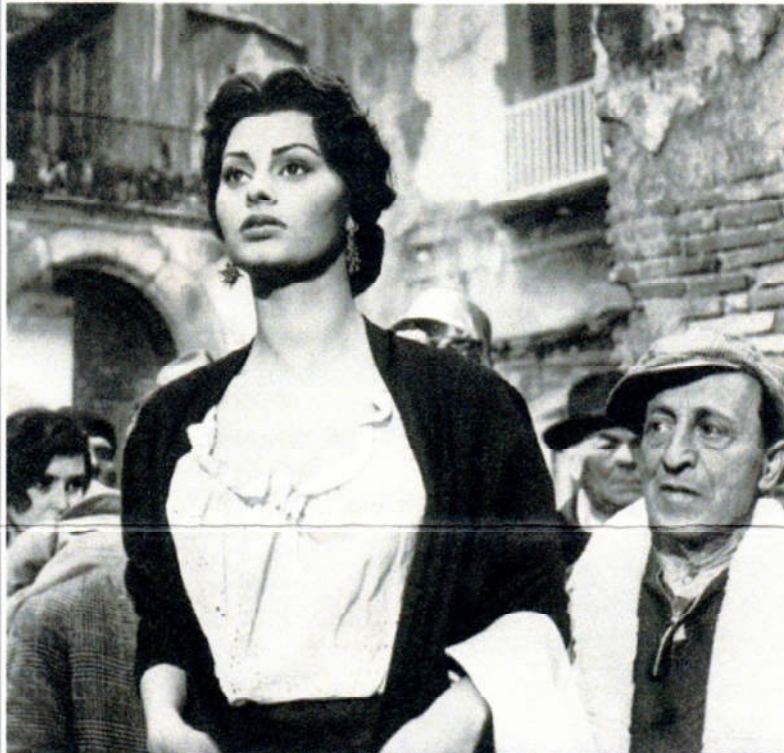
"L'oro di Napoli", in programma a Sorrento per il "Centenario della nascita di Vittorio De Sica"

Questo il "cartellone" completo delle proiezioni: Lunedì 19 Novembre " I bambini ci guardano " (1943); Mercoledì 21 Novembre " Ladri di biciclette " (1946); Venerdì 23 Novembre " Sciuscià " (1946); Lunedì 26 Novembre " L'oro di Napoli " (1954); Mercoledì 28 Novembre " Matrimonio all'italiana " (1964); Venerdì 30 Novem-