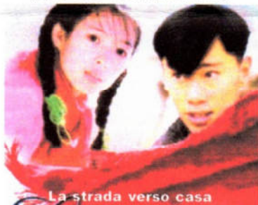
La strada verso casa

Giovedì 10 Maggio, ore 21 LA STRADA VERSO CASA di Zhang Yimou con Zhang Ziyi, Sun Hongley (Cina 1999 -Sentimentale-100')