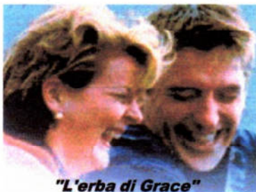
"L'erba di Grace"

L'ERBA DI GRACE di Nigel Cole con Brenda Blethyn, Craig Fergusson (GB 2000- Commedia - 92')